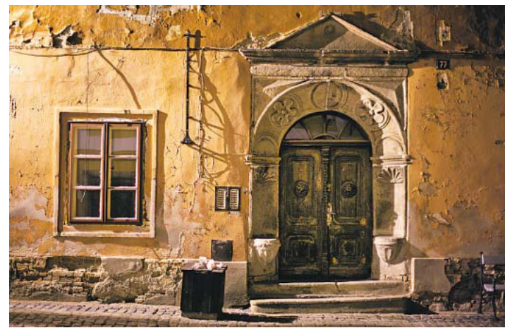
Rubig Blut! Das historische Stadtzentrum ist fast komplett restauriert.

dau gehauen wurde und mit Spitzbogen-Herrlichkeit gen Himmel strebt. Eleonores Grab ist schlicht, ohne Adelstitel, oder Wappen. Es liegt ein dicker bordeauxroter Teppich darüber, als wollte man Eleonores Existenz verschweigen.