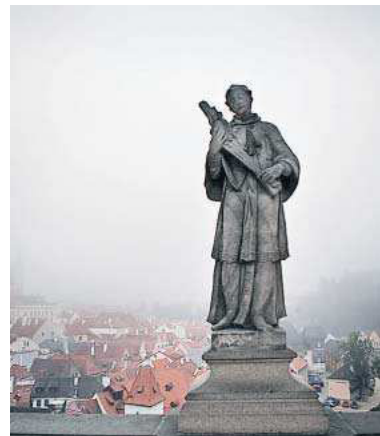
Benebelt: der Schutzbeilige

Orpheus singt, im Falsett: „Eile, folge meinen Schritten, einzige und ewige Geliebte.“ Eurydike