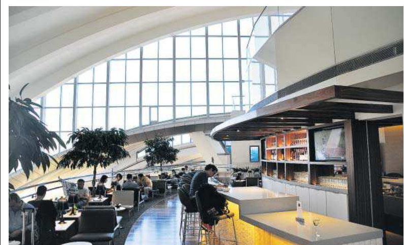
Der Flughafen zum Dableiben: das Bradley-Terminal in Los Angeles

Trend seinen Anfang, den amerikanischen Airlines, die seit 9/11 Vielfliegern kaum mehr etwas zu bieten und schlicht kein Geld für Innovationen hatten, niemand zugestimmt hätte: Lounges mit Außendeck. Neuerdings nämlich sind US-Gesellschaften profitabler als die meisten Europäer und ihnen auf einmal beim Luxus der vorderen Klassen voraus. So hat Delta innerhalb von gut einem Jahr fast alle Langstreckenjets mit flachen Betten in der Business Class ausgerüstet - Lufthansa braucht dazu fast viermal so lange, bei einem Drittel an umzurüstenden Flugzeugen. Im Frühsommer hat Delta im erweiterten Terminal 4 von JFK ihren Sky Club eröffnet, die mit über 2200 Quadratmetern Fläche größte Lounge im weltweiten Delta-Streckennetz.